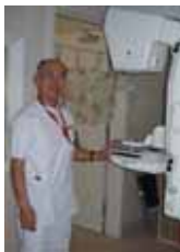
マンモグラフィ検査室。当院では女性の検査技師が行う

古賀 マンモグラフィは特殊なレントゲン検査で、乳房を圧迫して上下方向や斜方向から撮影します。乳癌特有の腫瘍である「微細石灰化」を明瞭に映し出せるので、早期発見に非常に有効です。一方、超音波検査では乳腺の断面写真を撮影できます。マンモでは発見しづらい1センチ未満の小さな腫瘍も発見できます。さらに必要であればMRI（磁気共鳴装置）や穿刺細胞診、時にPETで精密検査することも。中には良性か悪性が微妙な段階の症例もあります。