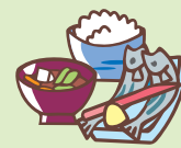
( )内は月経ありの方

A 貧血にはいくつかの種類がありますが、鉄欠乏性貧血の場合は、鉄分を多く含む食品になります。代表的な食品としては、レバー、牛や鶏の赤身肉、マグロ、カツオ、あさり、しじみ、ひじきなどの海藻類、ホウレンソウなどの緑黄色野菜、豆腐などの大豆製品などがあります。鉄分は吸収が悪い栄養素であるため、このような食品を意識的に食べることも、偏食をせずに色々な食品を摂り、ビタミンなどもしっかりと摂取することも重要です。