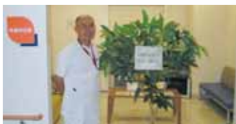
乳腺外科を受診する女性に配慮して用意された、専用の「乳腺待合室」。奥がマンモグラフィ検査室で、横に更衣室を備備

また2〜3センチ以下でリンパ節転移がないと思われる乳癌ではセンチネルリンパ生検を実施します。これは最初に転移すると考えられるリンパ節で、ここに転移がなければ、郭清を省略しようというものです。もつとも発見時すでに他への転移が認められれば、化学療法やホルモン療法から始めることもあります…。