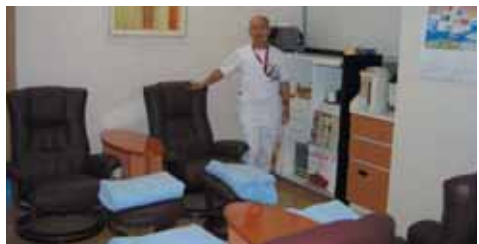
外科外来診察室の奥に設けられた「外来化学療法室」。4人用のほかに個室もある。ゆつたりとしたソファに雑誌類もあり、くつろいだ雰囲気です。